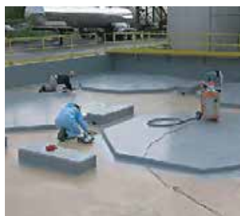
Protection des bacs de rétention