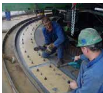
Collage par injection