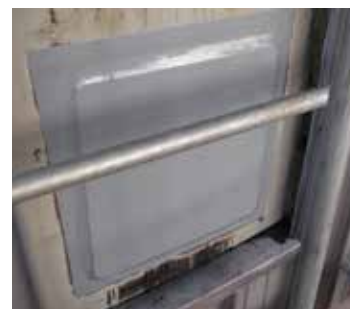
Protection des réparations