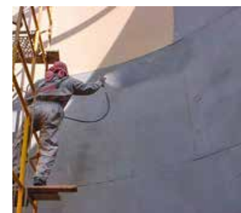
Revêtement des réservoirs

Pour plus d'informations, contactez votre représentant local Belzona :