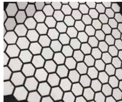
Scellement des carreaux d'alumine