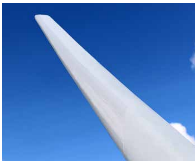
Belzona 5721 est disponible en deux couleurs, blanc et gris clair (RAL 7035)

Convient aux applications à des équipements similaires, dont les pales de ventilateur.