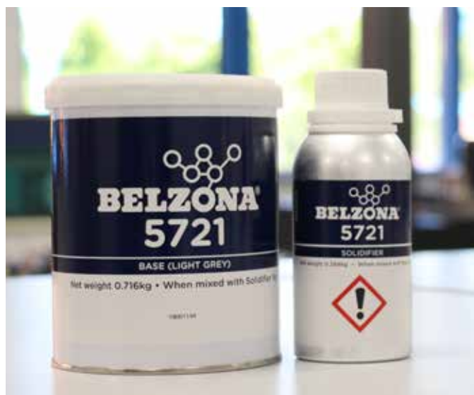
La taille de l'unité de Belzona 5721 est optimisée pour les applications sur site.

Pour plus d'informations, contactez votre représentant local Belzona :